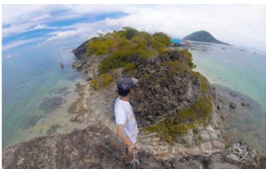
Pulau Liang-liang, Kecamatan Pulau Sembilan, Kabupaten Sinjai,