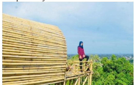
Bamboo Village Sinjai, Tanassang, Kabupaten Sinjai.