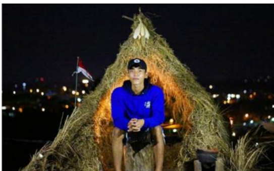
Bukit Pelangi Sinjai, Biringere, Sinjai Utara, Kabupaten Sinjai, Sulawesi Selatan.