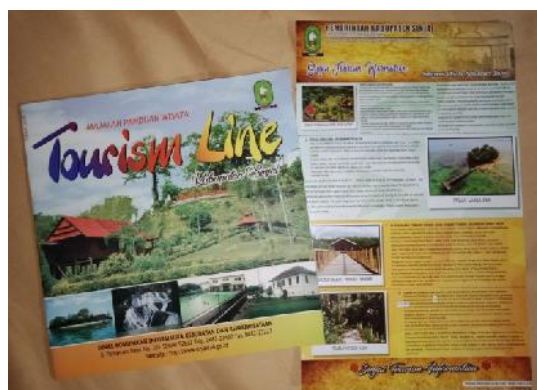
Gambar 4.1 Majalah Panduan Wisata Kabupaten Sinjai

Selain melakukan promosi melalui media elektronik dan media cetak Dinas Pariwisata juga melakukan promosi dengan melakukan hubungan masyarakat atau mempromosikan secara langsung kepada masyarakat dalam rangka meningkatkan kunjungan wisatawan di Kabupaten Sinjai,