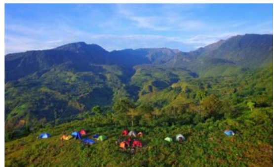
Bukit Taman Hutan Raya , Kecamatan Sinjai Borong, Kabupaten Sinjai, Sulawesi Selatan.