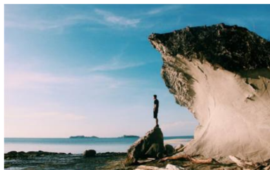
Pulau Larea-rea Kecamatan Pulau Sembilan, Kabupaten Sinjai.

Berdasarkan uraian diatas, maka penulis merumuskan permasalahan yang akan dibahas dalam penelitian ini adalah: