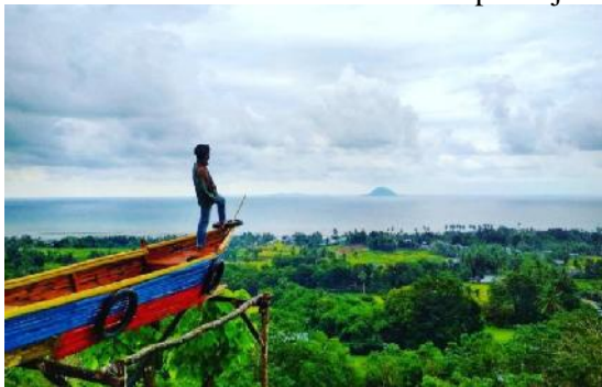
Bukit Vandiam Sinjai, Panaikang, Kecamatan Sinjai Timur, Kabupaten Sinjai.