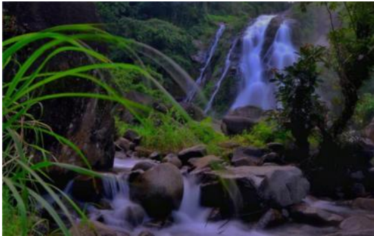
Air Terjun Laliako, Tonrong, Desa Terasa, Kecamatan Sinjai Barat, Kabupaten Sinjai.