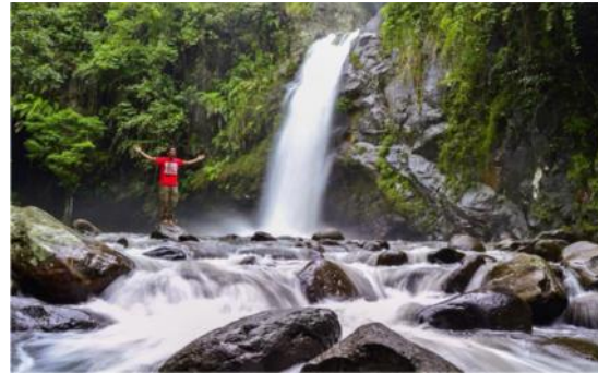
Air Terjun Picuni, Balakia, Kecamatan Sinjai Barat, Kabupaten Sinjai.