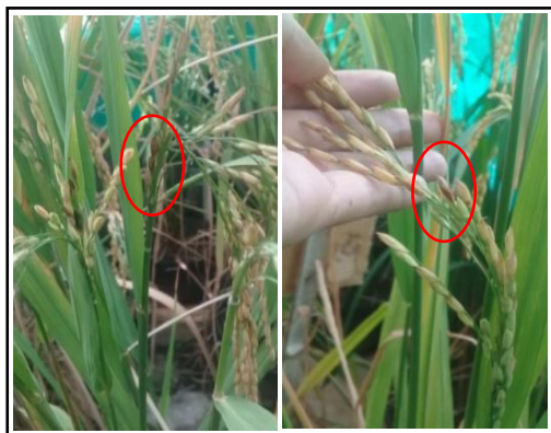
Gambar 1. Gejala busuk bulir pada malai tanaman padi

Pengamatan gejala penyakit bulir padi pada tanaman padi dapat dilihat Gambar 1.